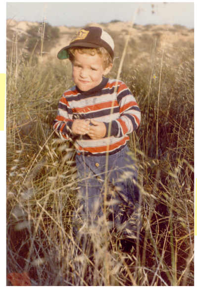
הוא יצא עם המשפחה לטיולים