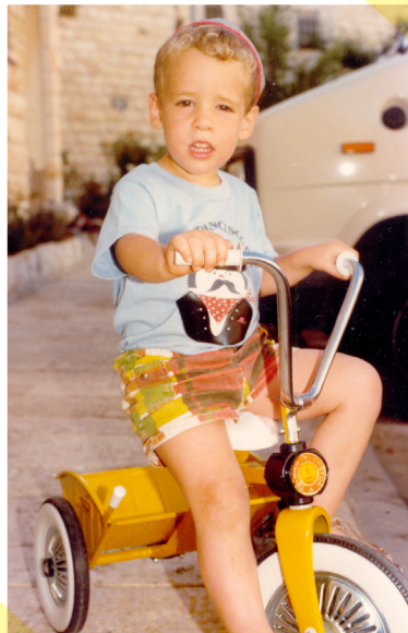
רכב על אופניים